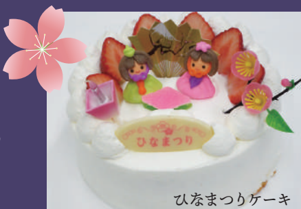
ひなまつりケーキ