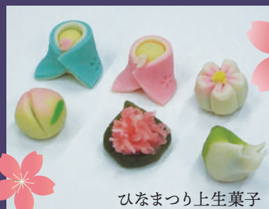
ひなまつり上生菓子